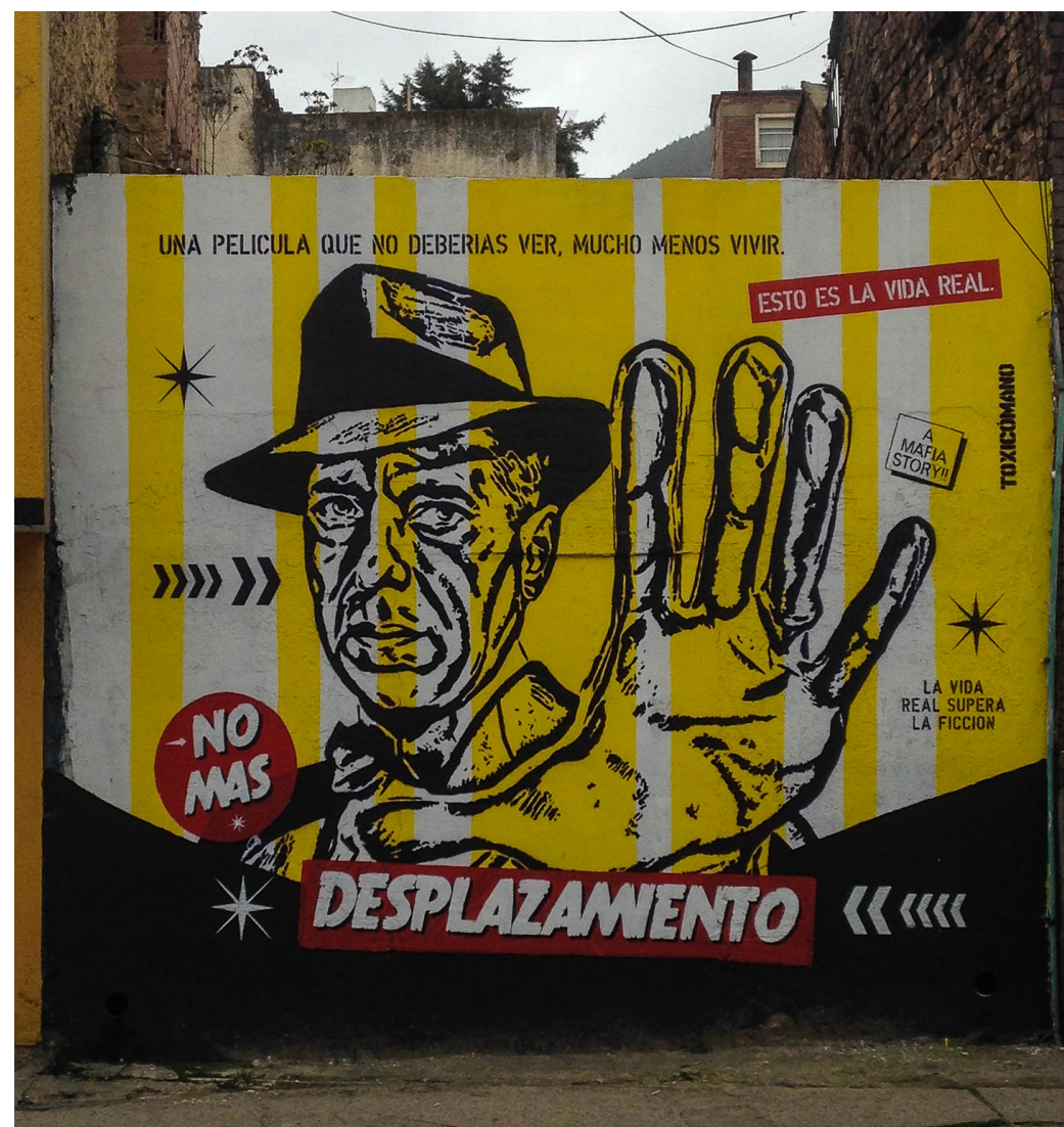
→ No más desplazamiento (Steven Taylor, 2014)

Finalmente, al tratarse de un proceso de victimización, los operadores jurídicos deben partir de un concepto amplio de daño. Así, para efectos de evaluar y otorgar la reparación, deben tenerse en consideración conceptos como “el daño emergente, el lucro cesante, el daño moral en sus diversas formas, el daño en la vida de relación, el desamparo derivado de la dependencia económica que hubiere existido frente a la persona principalmente afectada, así como todas las demás modalidades de daño” (CC C-052 de 2012). Así, el Consejo de Estado ha establecido que “constituye un hecho notorio que el desplazamiento forzado producen daño moral a quienes lo padecen, por lo cual no es necesario acreditar dolor, la angustia y la desolación que sufren quienes se ven obligados a emigrar del sitio que han elegido como residencia o asiento de su actividad económica” (CE 05001-23-31-000-2006-03647-01 (50941) de 2017). En suma, para que una justicia sea sensible a las necesidades de la población debe contemplar la situación de vulnerabilidad de las víctimas y además es actuar bajo una “concepción amplia del concepto conflicto armado”, en la medida que se atiende a todas las víctimas tomando en consideración aquella noción que “reconoce toda la complejidad real e histórica que ha caracterizado a la confrontación interna colombiana” (CC T-163 de 2017).