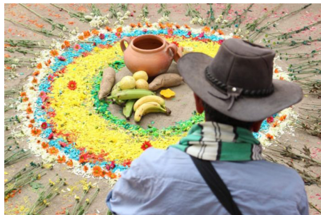
→ Luis Manjarrés para el CNMH (CNMH, 2015)

En suma, se puede decir que “la reparación se concreta a través de la restitución íntegra o plena al estado anterior al hecho que generó la victimización, pero también a través de la indemnización, de la rehabilitación, de la satisfacción de alcance colectivo, y de la garantía de no repetición” (CC C-166 de 2017).