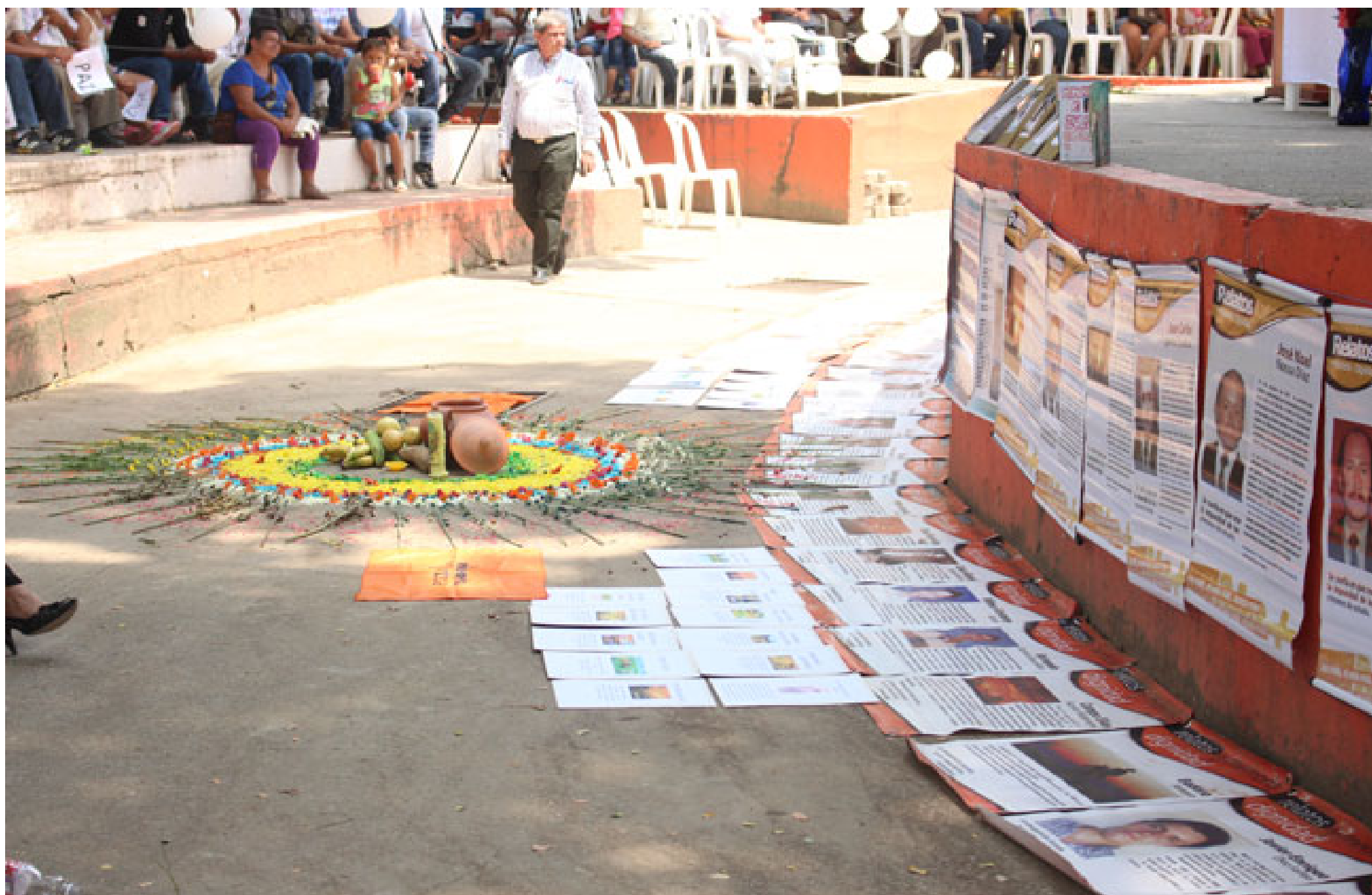
→ Luis Manjarrés para el CNMH (CNMH, 2015)

La Declaración Universal de los Derechos Humanos, en su artículo 30 establece que “todo individuo tiene derecho a la vida, a la libertad y a la seguridad de su persona” (CC SU-111 de 2020). De tal suerte que “el Estado tiene el deber de identificar, valorar y definir la situación de seguridad de las personas que se encuentran sometidas a riesgos o amenazas. Además, debe adoptar las medidas idóneas para mitigarlas y evaluar su eficacia y necesidad de manera periódica” (CC SU-111 de 2020).