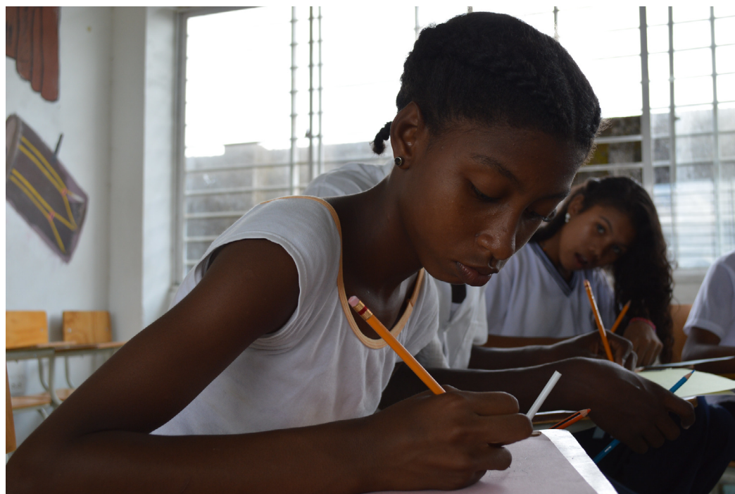
→ Dancing for Peace in Buenaventura 14(EC/ECHO/I. Coello, 2013)