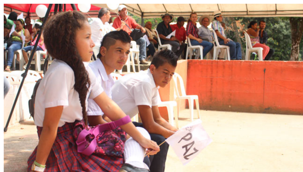
→ Luis Manjarrés para el CNMH (CNMH, 2015)

En cuanto a las personas con discapacidad, el artículo 12 de la Convención sobre los Derechos de las Personas con Discapacidad ha afirmado que tienen “capacidad jurídica en igualdad de condiciones que las demás [personas]”, de tal manera que “resulta irrazonable imponer barreras o límites para acceder a prestaciones económicas (...)” (CC T-298 de 2020). Asimismo, niños, niñas y adolescentes se enfrentan a una doble condición de vulnerabilidad. Por un lado, son víctimas del reclutamiento forzado y por otro, no siempre son reconocidos en su carácter de víctimas, consecuencia del propio reclutamiento (CC T-419 de 2019; CC SU-599 de 2019).