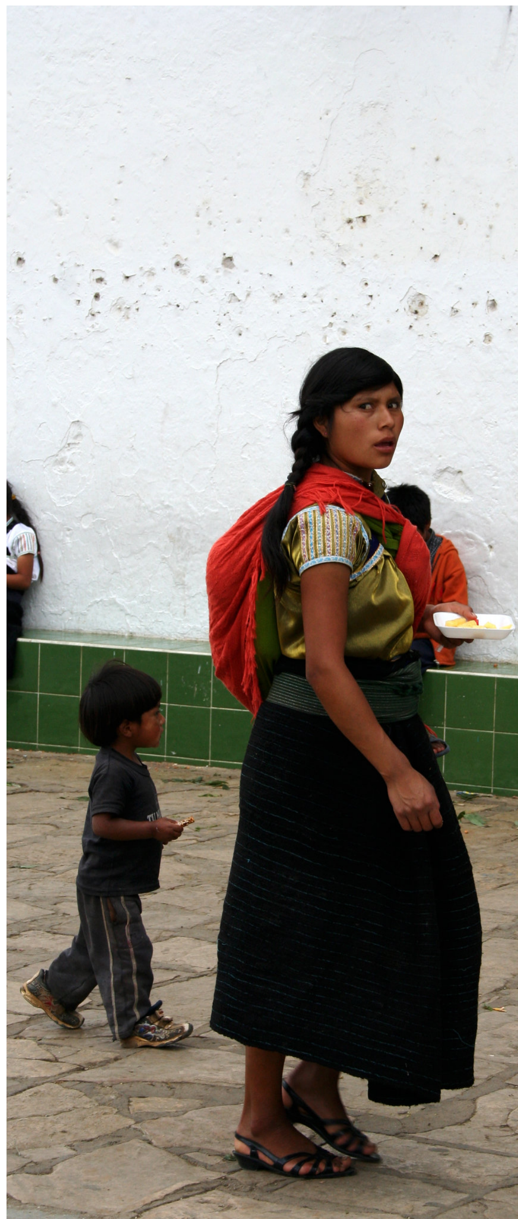
→ RECORTE DE San Juan Chamula (Chiara, 2010)

Por último, el desplazamiento forzado es un fenómeno que afecta de manera diferenciada a diversos grupos sociales, especialmente minorías étnicas y mujeres. De tal suerte que es necesario observar el desplazamiento bajo la óptica de un enfoque diferencial. En esta línea, la Corte Constitucional ha remarcado que “(...) en contextos de conflicto armado en los que estos pueblos [indígenas, minorías étnicas y/o mujeres] pueden resultar afectados desproporcionalmente por sus condiciones de vulnerabilidad y ante las disputas de las partes enfrentadas en los lugares donde habitan y desarrollan sus modos de vida” (CC SU-092 de 2021). En efecto, el desplazamiento forzado es un fenómeno complejo, con características propias y consecuencias concretas para las víctimas, como la vulneración de cierto tipo de derechos.