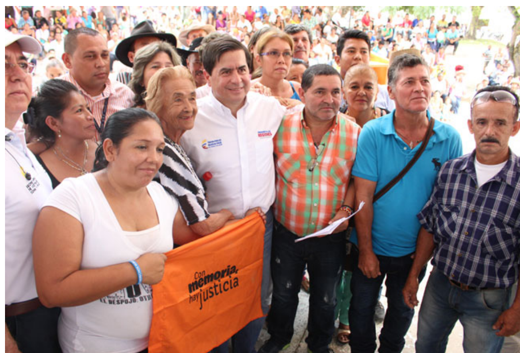
→ Luis Manjarrés para el CNMH (CNMH, 2015)