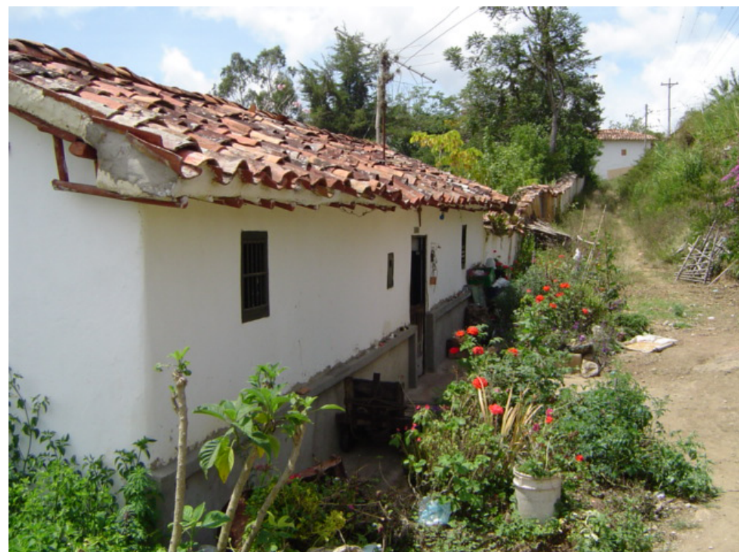
→ Vivienda rural

“El trabajo es una garantía de estabilización económica de los desplazados” (CE 17001-23-31-000-2009-00155-01 de 2009). Por tanto, el Estado debe brindar garantías para el acceso al trabajo; por ejemplo, la jurisprudencia ha enfatizado que “especialmente en el caso de los agricultores que se ven forzados a migrar a las ciudades y, en consecuencia, abandonar sus actividades habituales” (CC T-025 de 2004), el acceso al trabajo debe “garantizar medios para la obtención de un nivel de vida adecuado” (CC T-025 de 2004).